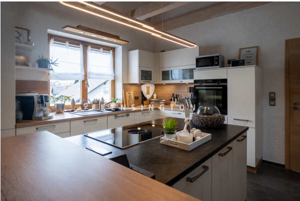
Mit praktischer Kochinsel!