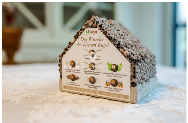
Natürlich gebaut mit der Wunderkugel!