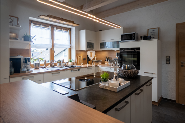
Mit praktischer Kochinsel!