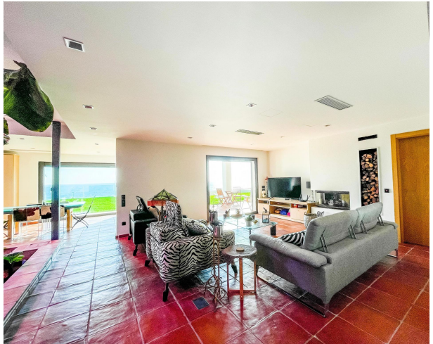
WhatsApp Image 2024-05-23 at 18.20.36