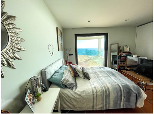
WhatsApp Image 2024-05-23 at 18.20.33