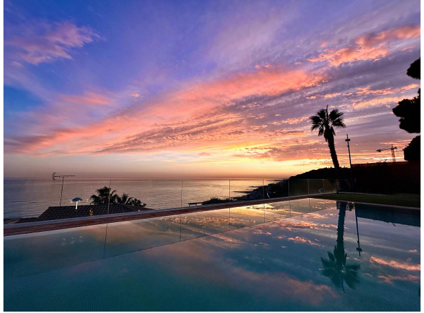
WhatsApp Image 2024-05-23 at 18.20.35 (1)