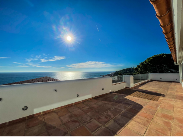
WhatsApp Image 2024-05-23 at 18.20.39 (2)