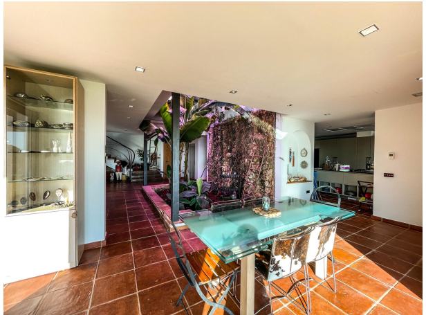
WhatsApp Image 2024-05-23 at 18.20.37