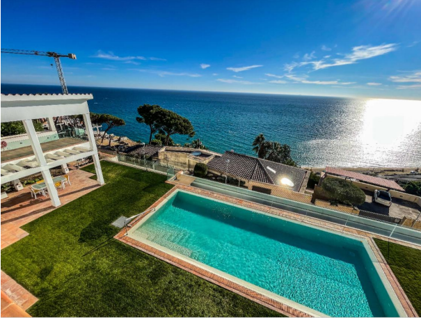
WhatsApp Image 2024-05-23 at 18.20.32 (2)