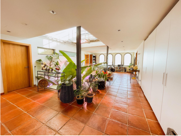
WhatsApp Image 2024-05-23 at 18.20.32