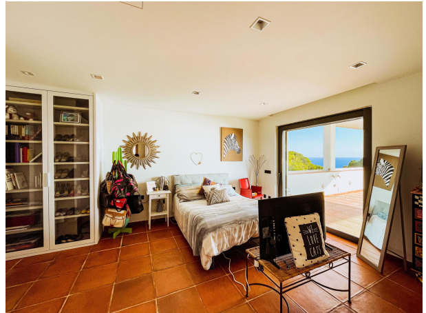
WhatsApp Image 2024-05-23 at 18.20.34 (2)