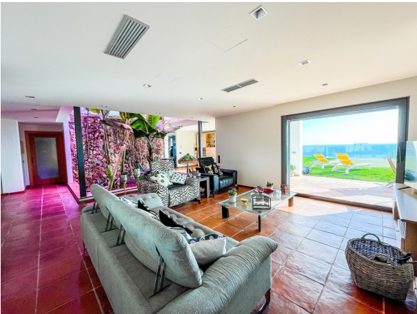
WhatsApp Image 2024-05-23 at 18.20.34