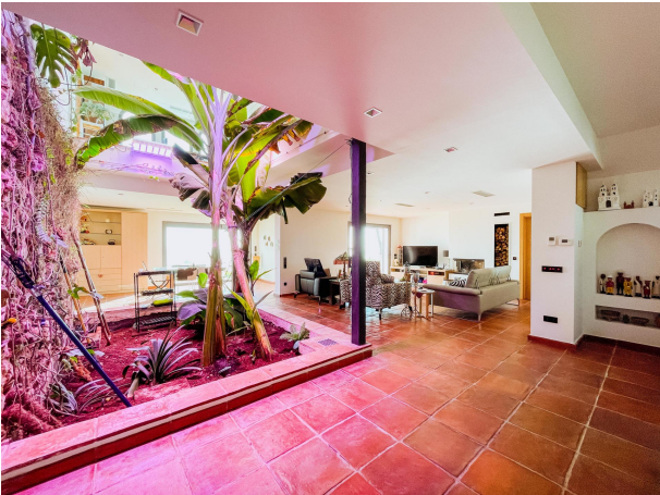
WhatsApp Image 2024-05-23 at 18.20.35