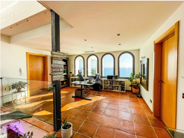
WhatsApp Image 2024-05-23 at 18.20.31