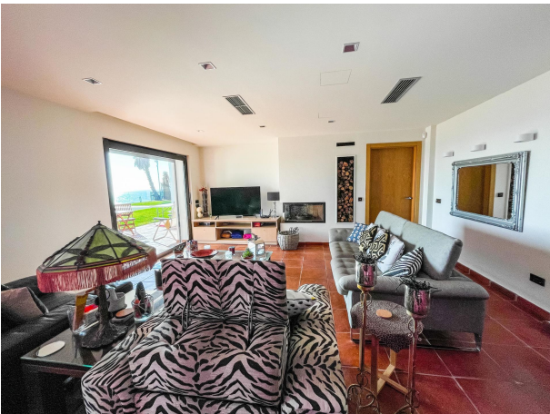
WhatsApp Image 2024-05-23 at 18.20.37 (1)