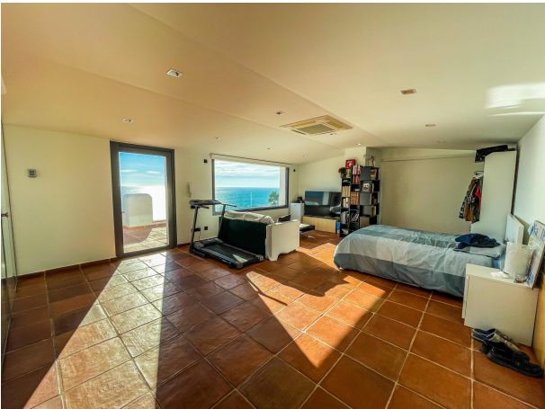
WhatsApp Image 2024-05-23 at 18.20.36 (1)