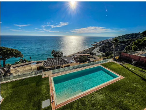
WhatsApp Image 2024-05-23 at 18.20.39 (1)