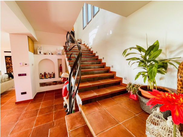
WhatsApp Image 2024-05-23 at 18.20.34 (1)