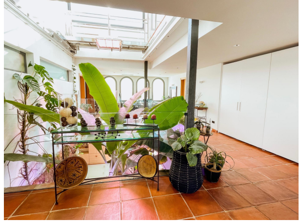
WhatsApp Image 2024-05-23 at 18.20.30