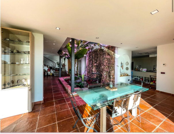
WhatsApp Image 2024-05-23 at 20.06.26